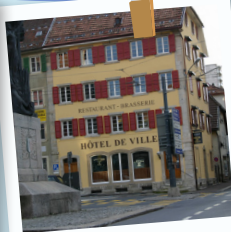
La Chaux de Fonds